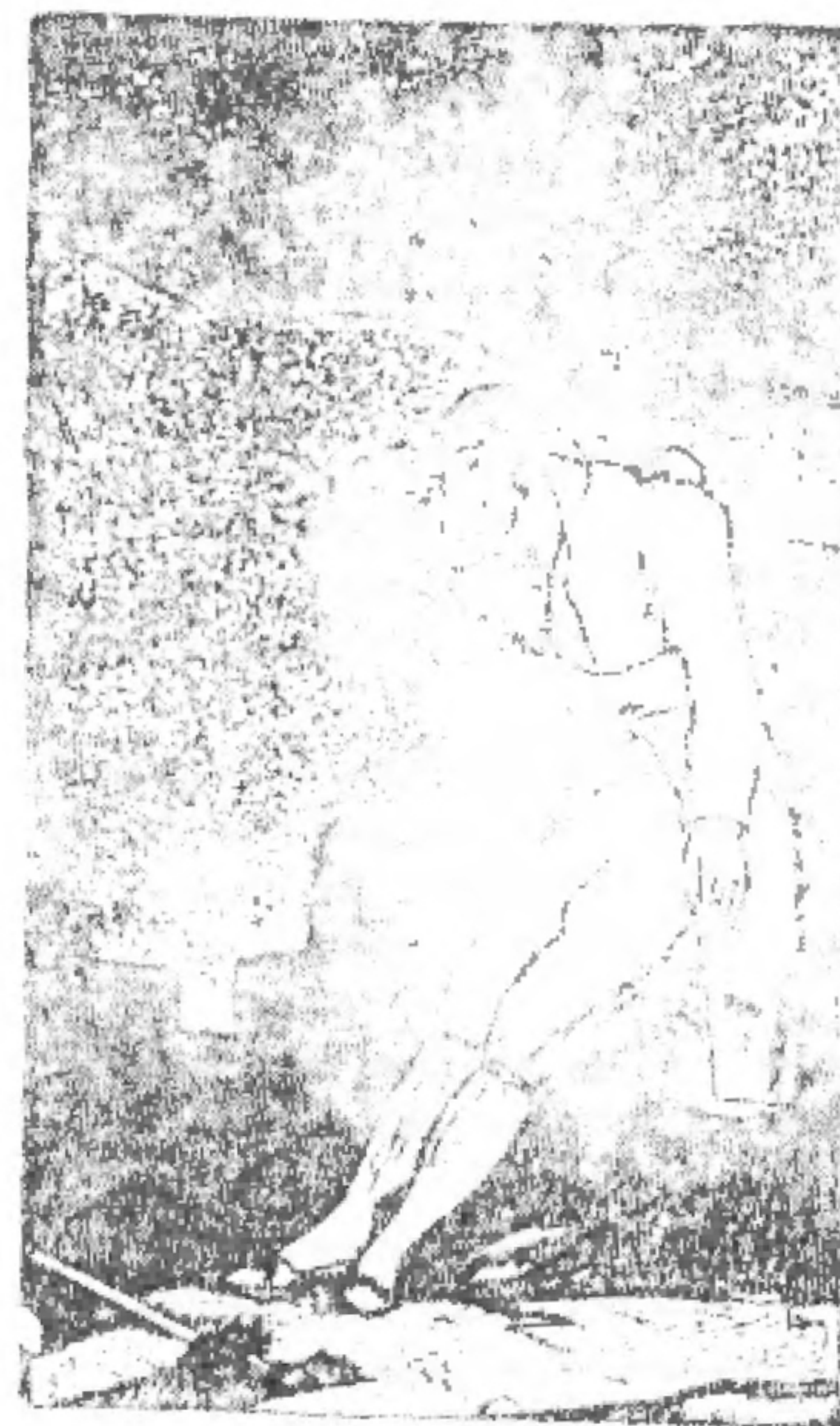
Ilustración de la docente Guadalupe Rivera