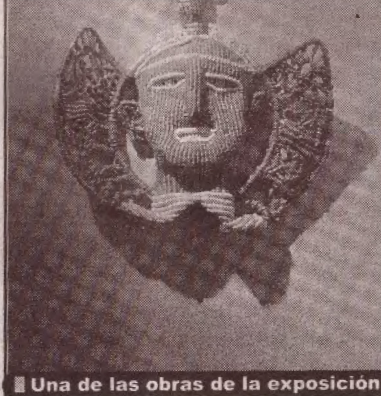
■ Una de las obras de la exposición

En la creación de Ester Chacón se encuentran los colores y las fibras entre sí; por medio de los nudos, las líneas se aventuran en busca de figuras y las figuras en busca de destinos. "Hay piezas multifacéticas", comentó, "porque así resultan al final. Nunca voy dibujando. Mi punto de partida son los colores y las texturas. Empiezo a anudar y, como los nudos tienen un lenguaje propio, son ellos los que me van llevando".