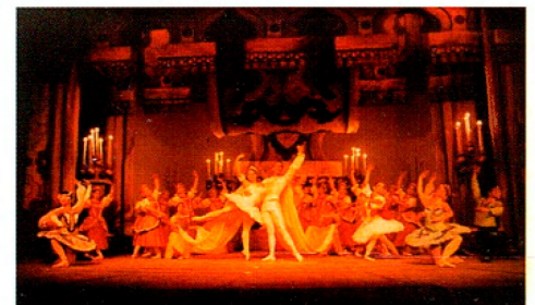
- El Ballet Clásico de Querétaro escenificando La Bella Durmiente -

el Ballet Nacional de Cuba, máxima institución del país caribeño en la materia. El curso se realiza durante el periodo vacacional de Semana Santa, buscando el perfeccionamiento técnico y artístico de los bailarines, así como expandir los vínculos de esta Compañía con el exterior.