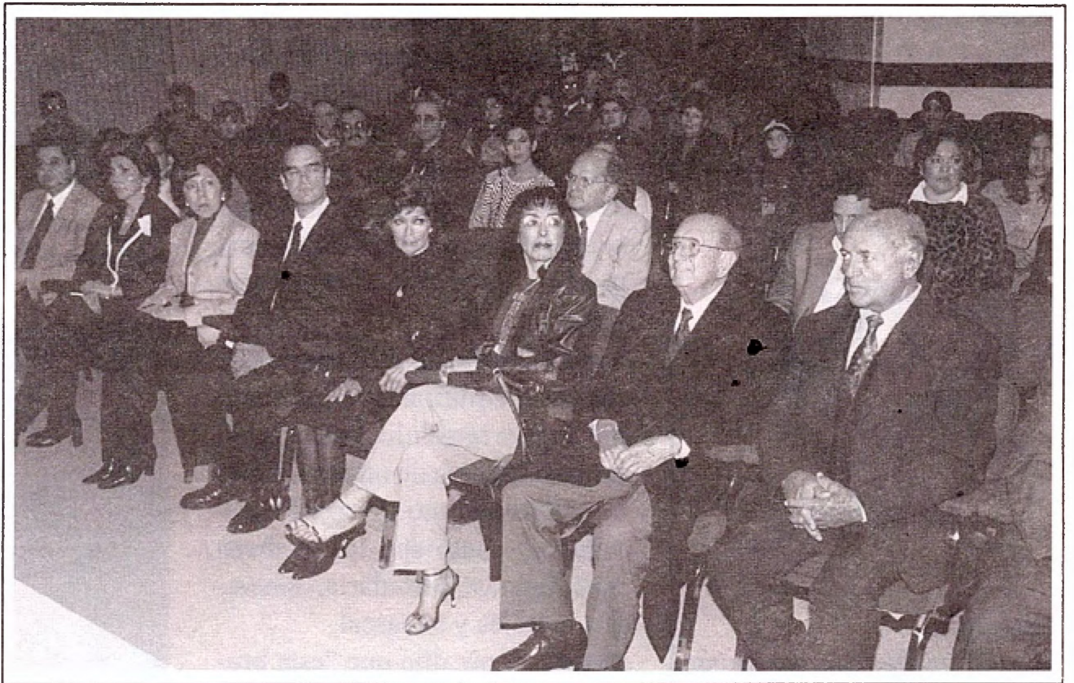
Familiares, exrectores, exgobernadores y la comunidad universitaria en general durante el homenaje al fundador del Alma Mater