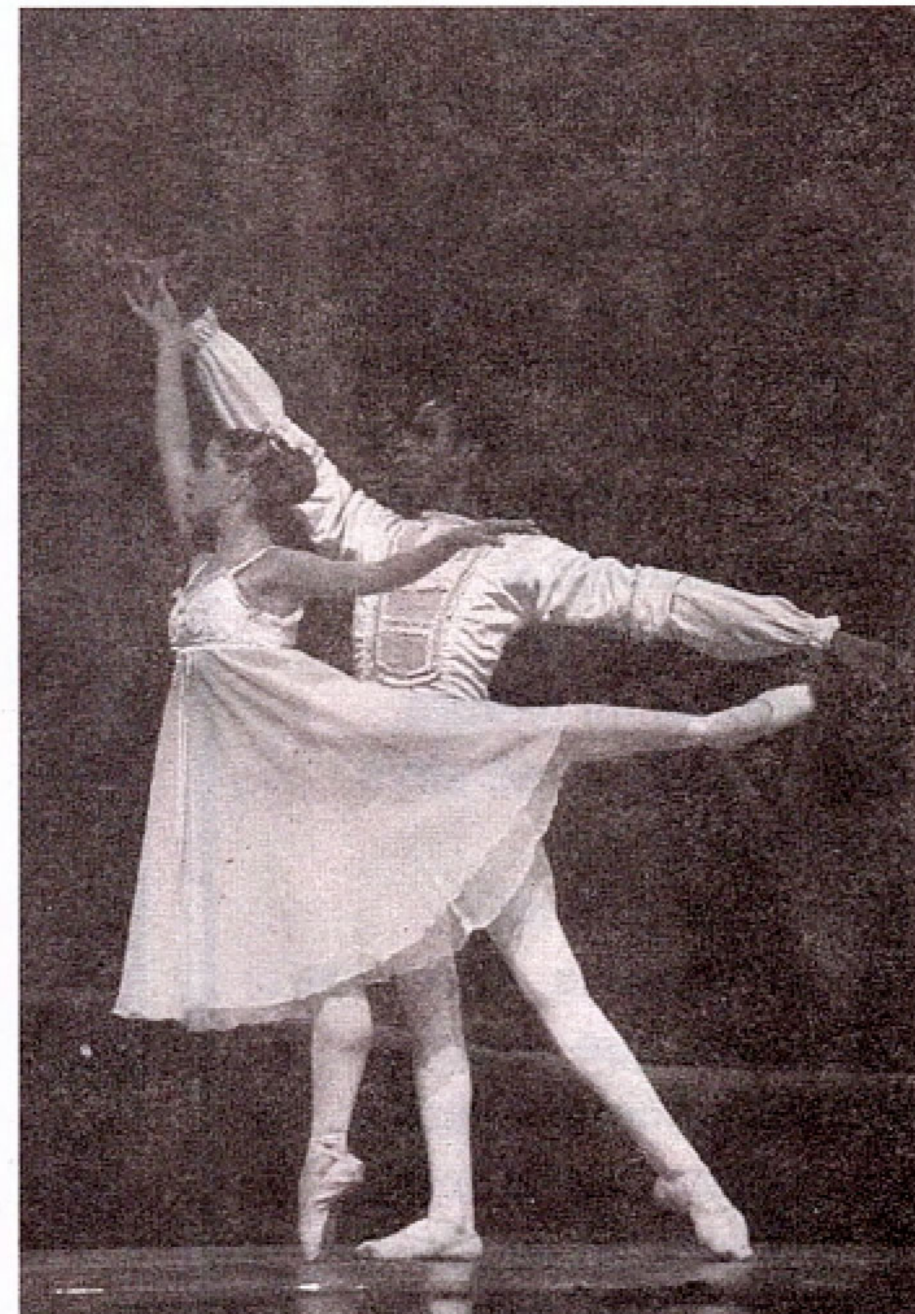
Durante la puesta en escena al ritmo de la música de la suite compuesta por Tchaicowsky, "El Cascanueces", el pasado 28 de noviembre en el teatro del Seguro Social