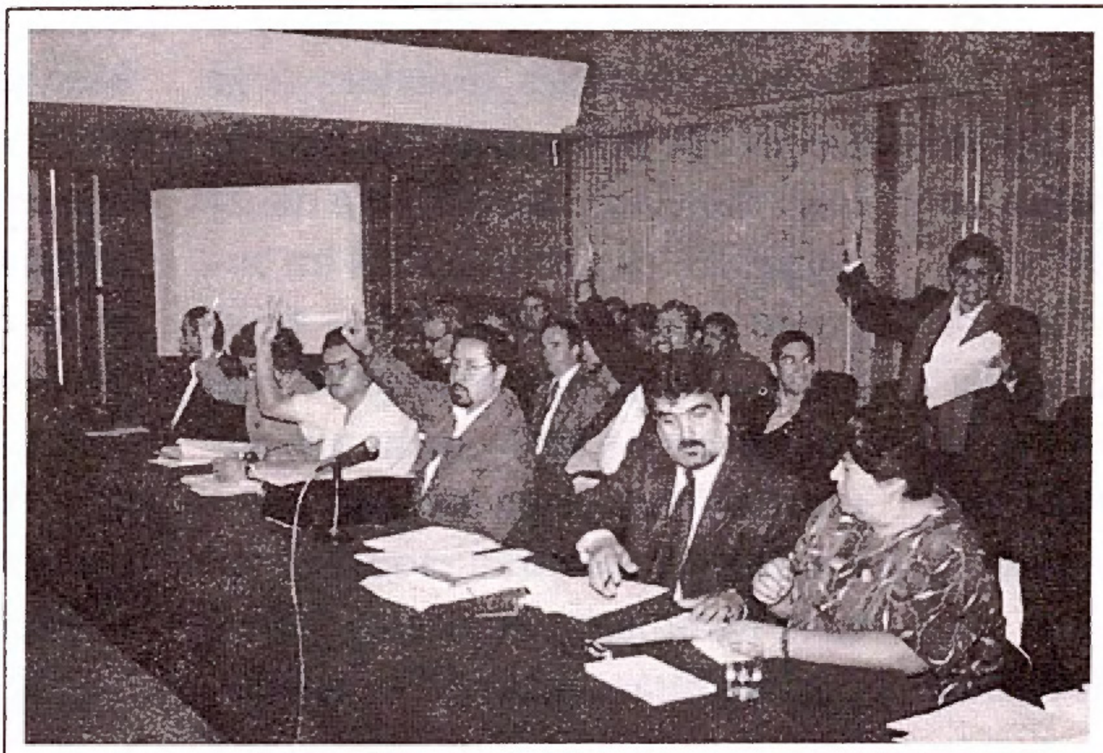
Miembros del Consejo Universitario votando en la sesión ordinaria de noviembre